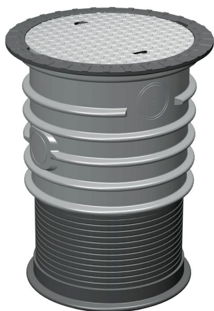
PKW-Komplettset 1 Höhe 700 – 1.100 mm