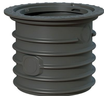
Schachtverlängerung bis zu 60 cm