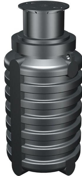
ohne Einbauten mit Schiebedom und Abdeckung