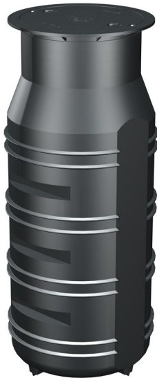
ohne Einbauten mit Abdeckung