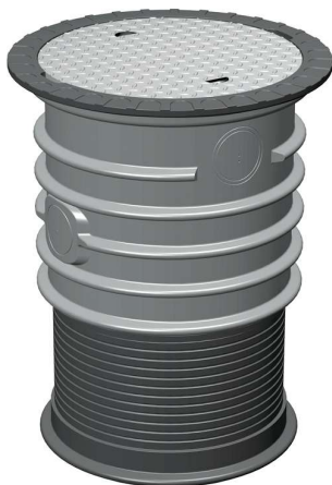
PKW-Komplettset 1 Höhe 700 – 1.100 mm