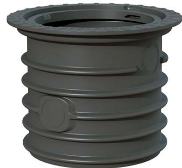
Schachtverlängerung bis zu 60 cm